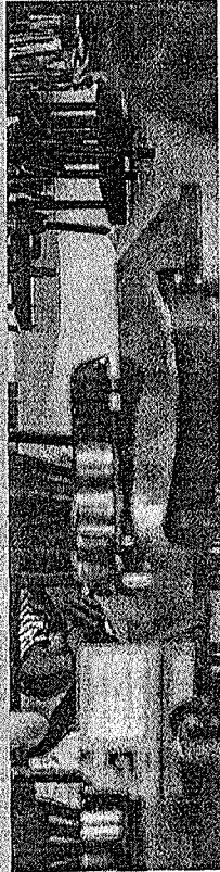
SETOR de serviços é o responsável pelo saldo positivo de empregos no Ceará

Em contrapartida, o destaque negativo ficou com as atividades relacionadas aos setores da agricultura, pe-